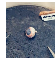
Sezieren eines Auges Bio-Leistungskurs